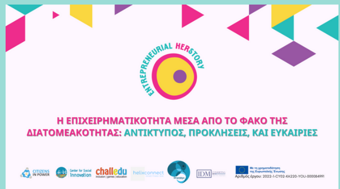
Εξώφυλλο των γραφικών της σειράς Podcast του ΕΗ

Τόσο ο Οδηγός όσο και όλα τα επεισόδια του Podcast είναι διαθέσιμα σε 5 γλώσσες , συμπεριλαμβανομένων των αγγλικών (EN) και όλων των εθνικών γλωσσών των οργανισμών-εταίρων, δηλαδή ελληνικά (EL) , ολλανδικά (NL) , ρουμανικά (RO) και ισπανικά (ES) .