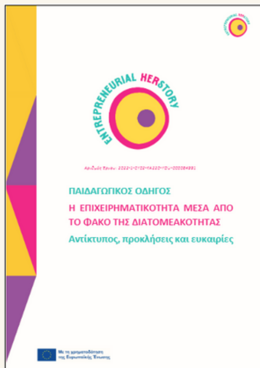
Εξώφυλλο του Παιδαγωγικού Οδηγού του ΕΗ

Προκειμένου να αυξηθεί η προσβασιμότητα και η απήχηση του υλικού, ο Οδηγός έχει μετατραπεί και διαμορφωθεί σε μια σειρά Podcast με τον ίδιο τίτλο, η οποία έχει συμπληρωματικό χαρακτήρα και περιλαμβάνει 5 επεισόδια.