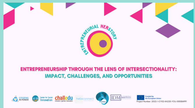
Voorpagina van grafische voorstellingen EH Podcastserie

Zowel de gids als alle podcastafleveringen zijn beschikbaar in 5 talen , waaronder Engels (EN) en alle nationale talen van de partnerorganisaties, namelijk Grieks (EL) , Nederlands (NL) , Roemeens (RO) en Spaans (ES) .