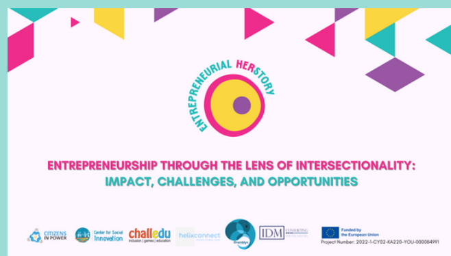
Coperta grafică a seriei de podcasturi HA

Atât Ghidul Pedagogic, cât și toate episoadele Podcastului sunt disponibile în 5 limbi , inclusiv engleză (EN) și toate limbile naționale ale organizațiilor partenere, respectiv greacă (EL) , olandeză (NL) , română (RO) și spaniolă (ES) .